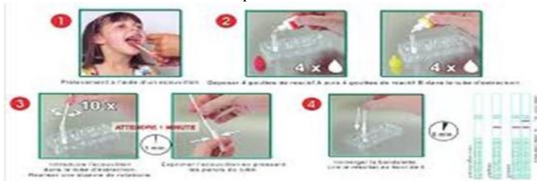
Figure 1 : TDR : mode de prélèvement et interprétation des résultats

- Permettent un diagnostic au cabinet du médecin afin de ne traiter que les angines streptococciques ; ceci aurait un impact écologique et économique non négligeable. Le principe de ces tests repose sur la mise en évidence d'un antigène spécifique de la paroi bactérienne du SGA directement à partir de l'écouvillonnage de gorge. Cette méthode permet un diagnostic en moins de 10 mn au cabinet du médecin. La spécificité de ces tests est voisine de 95 % et la sensibilité supérieure à 90 %.