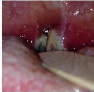
Figure 12.2. Mononucléose infectieuse.