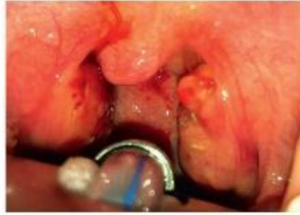
Figure 12.4. Amygdalite caséuse.