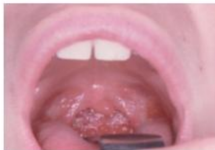
Figure 12.3. Pharyngite granuleuse.

EBV: virus d'Epstein-Barr; MNI = mononucléose infectieuse; TDR : test de diagnostic rapide pour le streptocoque du groupe A.